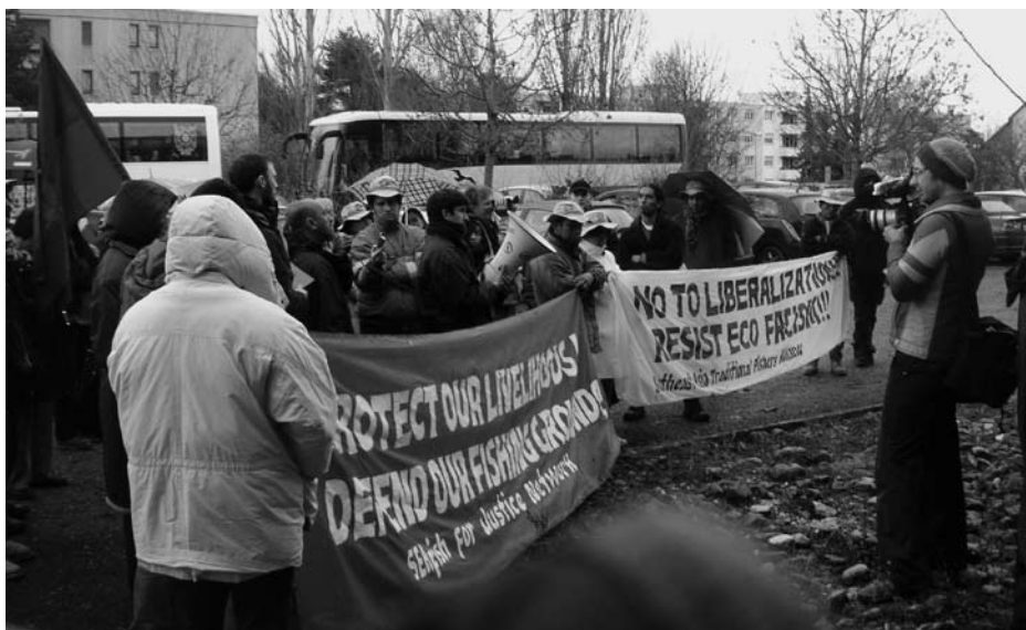
Gland bei Genf, 3.12.09: auf dem Weg von Genf nach Kopenhagen. Protesthalt der Climate and Social Justice-Karawane vor dem internationalen Sitz des WWF.

Letzten September ging der WWF eine Allianz mit dem Unternehmen Novozymes ein mit dem Namen «Biosolutions Initiative – Eliminating the first billion tonnes of CO 2 . Novozymes, ein führendes Unternehmen in Biotech, ist auf Bakterien und Enzyme spezialisiert, das die Entwicklung von Agrosprit der 2. Generation massiv pusht. Zuvor hatte der WWF Dänemark den auf Kalkulationen von Novozymes beruhenden Bericht «Industrial Biotechnology – more than green fuel in a dirty economy?» publiziert. Dieses Papier pusht vor allem die «weisse Biotechnologie», die Bioökonomie und das neue Konzept von Bioraffinerie (s. Kasten). Im Wesentlichen geht es dabei um die Verwendung von gentechnisch manipulierten Zellen und Enzymen für die Industrie und die Energieerzeugung 6 . In einem ins Internet durchgesickertem Dokument geht es um die Kollaboration des WWF mit Novozymes am Klimagipfel. Es geht dabei um die Agenda von Europabio, der grössten Bio-Lobbygruppe in Europa 7 Clay hat sich auch für die